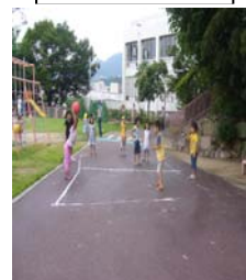
自分たちで線を引いたコート で。狙いを定めて～、エイッ