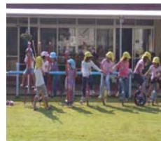
みんなで手をつない で、よーい・どん！