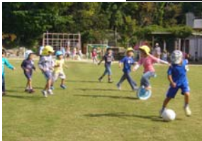
「パス、パス！」友だちから のパスがまわってきたぞ！