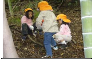
友だちと足を踏ん張ってた けのこほり