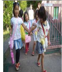
ぞうりを履くと、姿勢がよ くなる！