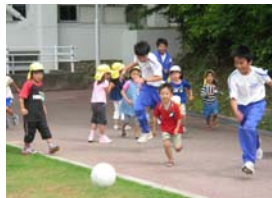
トライやるのお兄さんにも 負けません！