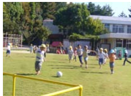
お庭全部がサッカーコート