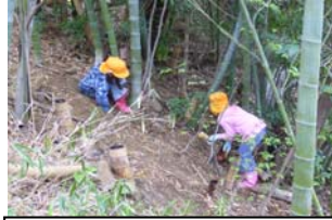
「こっちへきて」 ゆっくり 用心して友だちのもとへ