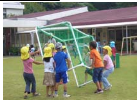
ゴールの準備も自分たちで